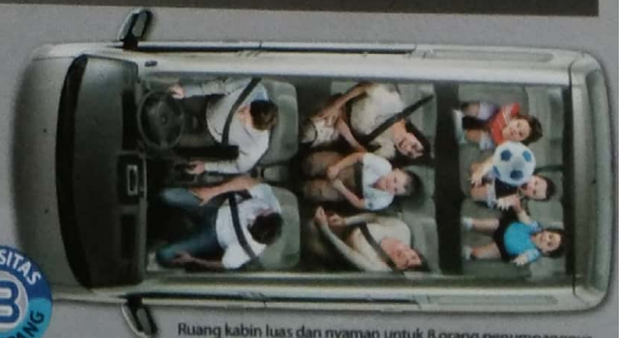
Ruang kabin luas dan nyaman untuk 8 orang penumpangnya serta dapat menampung beragam barang bawaan, sehingga menambah keceriaan keluarga.