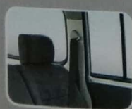
Seat Belt Suzuki APV memiliki tingkat keamanan yang prima, sabuk pengaman di bangku baris pertama dan kedua memberi jaminan keamanan sempurna.