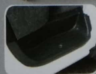
Foot Step Memberikan kemudahan bagi seluruh anggota keluarga saat memasuki kendaraan.