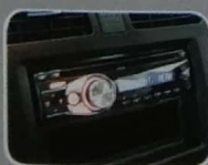
1 Din Audio Perjalanan menjadi lebih menyenangkan dilirungi musik favorit keluarga.