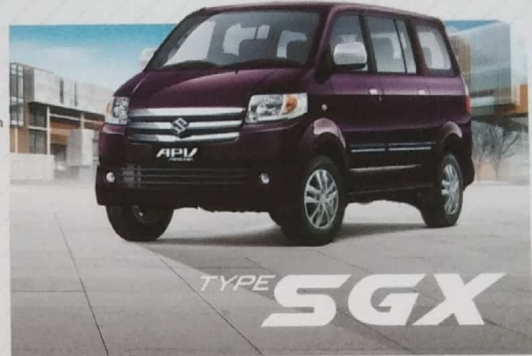
Suzuki APV memiliki ruang yang legaa, lengkap dengan fitur yang modern, menghadirkan keleluasaan, kemewahan dan kenyamanan.