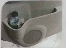
DOOR TRIM CONSOLE * GL, GX, SGX, LUXURY