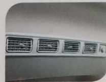
AC DOUBLE BLOWER * GX, SGX, LUXURY