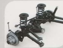
REAR SUSPENSION WITH COIL SPRING * GL, GX, SGX, LUXURY