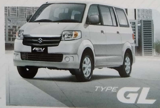
Ruang yang luas dan multifungsi dengan kenyamanan untuk 8 penumpang.