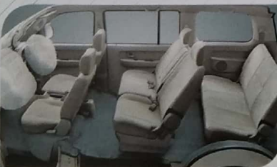
Tempat duduk untuk 8 orang, lebih lega dan lebih nyaman dalam perjalanan.