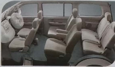
Captain Seat mewah yang dapat menghadirkan kenyamanan selama perjalanan.