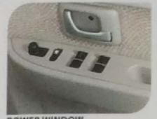
POWER WINDOW * GL, GX, SGX, LUXURY