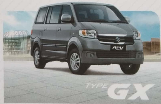
Suzuki APV GX dengan kapasitas 8 penumpang memberikan rasa nyaman dan lega saat berkendara.