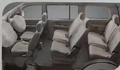
Tempat duduk untuk 8 orang, dilengkapi dengan arm rest, lebih nyaman dalam perjalanan.